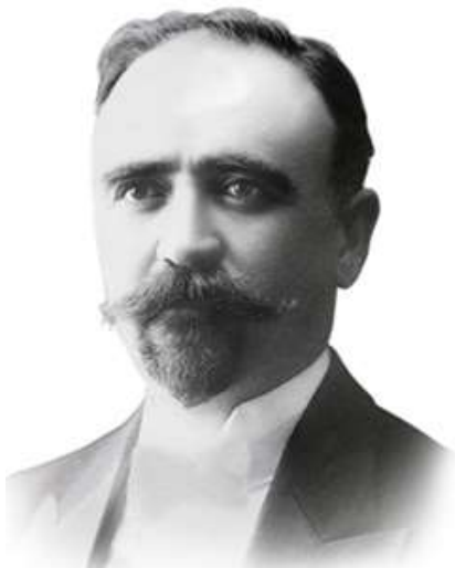
Francisco I. Madero

El poder público no puede tener otro origen ni otra base que la voluntad nacional