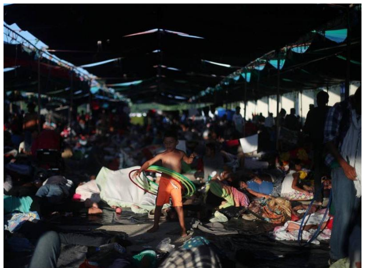
Un niño migrante en un campamento en Juchitán (México).

¿Qué cambio observas cuando está de regreso a casa?