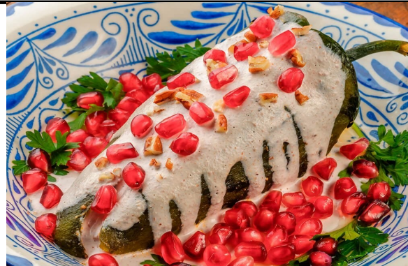
Chiles en Nogada, tradición en un sólo platillo