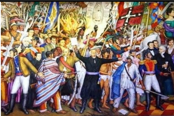
“Independencia de México “Diego Rivera”

Observa las imágenes en compañía de tu familia.