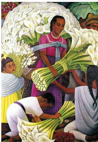
“Las Calas” de Diego Rivera